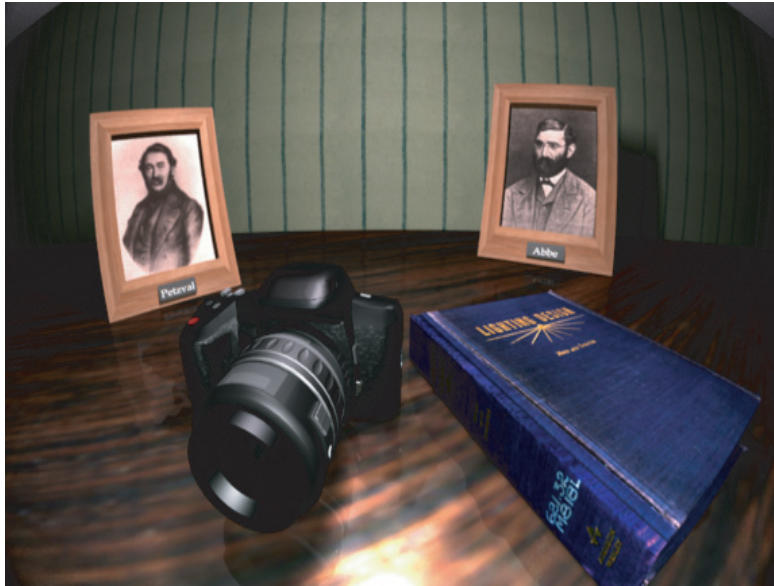
Abbildung 2.1: Simulation einer Fischaugen-Optik, wobei speziell die fassförmige Verzerrung und die Verdunkelungen in den Ecken auffallen (entnommen aus [20])

benötigten SDL-Dateien (Anhang D) in ihrer Form als Textdateien gut verständlich und ausreichend dokumentiert [3], was deren Generierung in einem Programm vereinfacht.