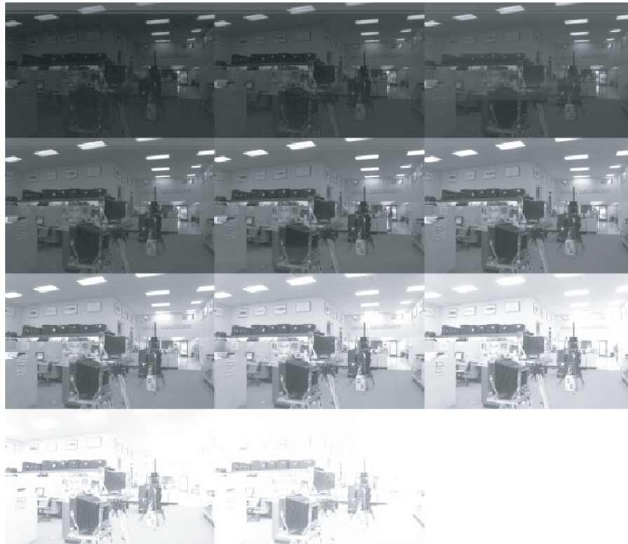
Abbildung 2.2: Elf Aufnahmen einer Innenszene, erstellt mit einer Kodak DCS460 Digitalkamera, Belichtungszeit zwischen \frac{1}{30} s und 30s im Abstand von jeweils einer Blendenzahl (entnommen aus [8])

Debevec und Malik schlagen in [8] eine Methode vor, um anhand mehrerer aufeinanderfolgender Aufnahmen mit unterschiedlicher Belichtungszeit eine Strahlungsdichte-Karte mit einem hohen dynamischen Bereich zu erstellen. Dies bedeutet, dass der typischerweise verwendete RGB-Farbraum mit einer typischen Tiefe von acht Bit je Grundfarbe auf einen grösseren Bereich erweitert wird. In [8] wird eine Art Fließkommazahlendarstellung in der Form RGBE verwendet, wobei das E für den Exponenten steht.